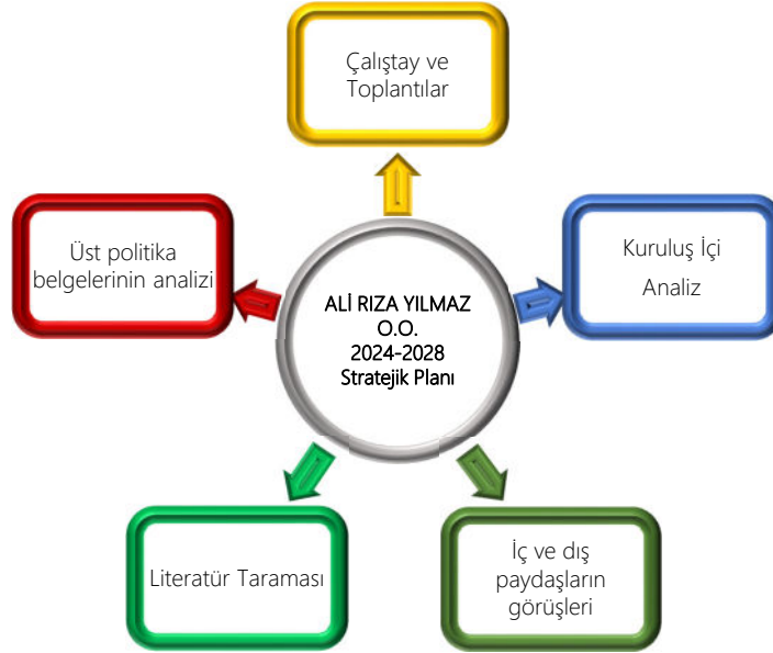
Şekil 1. Stratejik Plan Hazırlama Süreci

2024-2028 dönemi stratejik plan hazırlanması süreci Üst Kurul ve Stratejik Plan Ekibinin oluşturulması ile başlamıştır. Ekip tarafından oluşturulan çalışma takvimi kapsamında ilk aşamada durum analizi çalışmaları yapılmış ve durum analizi aşamasında paydaşlarımızın plan sürecine aktif katılımını sağlamak üzere paydaş anketi, toplantı ve görüşmeler yapılmıştır.